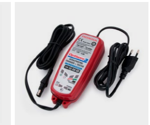
Honda Optimate 3 08M51-EWA-601E Dostosowana do wszystkich typów akumulatorów kwasowo-ołowiowych 12 V o pojemności od 3 do 50 Ah. Skuteczna w przypadku silnie rozładowanych akumulatorów (nawet 2 V). Brak ryzyka przeładowania. Całkowicie bezpieczna dla elektroniki pojazdu.