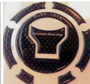
Osłona zbiornika paliwa 8P61-MJM-800A Imitacja włókna węglowego.