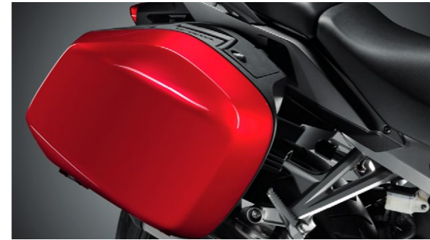
Kufry boczne 08ESY-MJM-PANZA, B lub K

Zestaw dwóch zintegrowanych, aerodynamicznych kufków o pojemności 29 litrów każdy w dopasowanym kolorze. Montowane bezpośrednio do motocykla (nie wymagają stelaży), otwierane kluczykiem motocykla. Lewy kufier może pomieścić większość pełnych kasków. Dostępne w trzech kolorach: - Victory Red (PANZA) - Darkness Black Metallic (PANZB) - Digital Silver Metallic (PANZK) Zestaw zawiera wkładkę zamka oraz paski do mocowania bagażu wewnątrz.