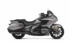
Mat Majestic Silver Metallic