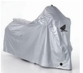
Pokrowiec do stosowania na zewnątrz (obejmuje kufry) 08P34-MCH-000 Wodoodporny, oddychający materiał, który umożliwia wyschnięcie przykrytego motocykla oraz chroni lakiery przed wyblaknięciem od promieni UV. Regulowana linka zabezpiecza pokrowiec przed trzepotaniem na wietrze. Dwa otwory z przodu u dołu umożliwiają łatwe zamocowanie blokady U-lock. Przykrywa kufry górny i kufry boczne