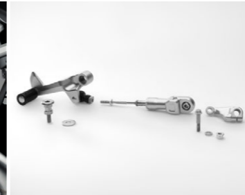
Quick Shifter 08U70-MJM-D11 Zestaw Quick Shifter ułatwia zmianę biegów oraz podnosi komfort jazdy.