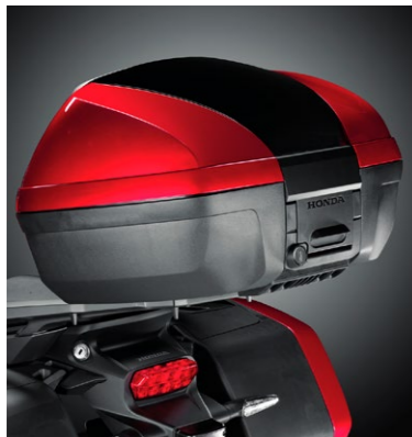
Zestaw kufra górnego 45L 08ESY-MJM-TB45ZF, C lub Z

Wymagany do montażu kufra górnego 31/45L