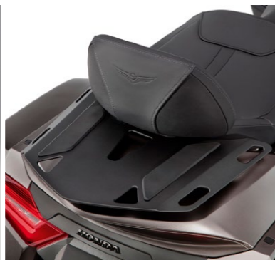
Zestaw oparcia pasażera 08R70-MKC-A10

Podnoszą widoczność podczas pochmurnych dni, w nocy lub podczas jazdy w mgłę. Para regulowanych przednich świateł przeciwmglnych LED. Strumień białego światła o wartości 880 lumenów z utwardzoną powierzchnią soczewki i wodoodpornymi złączami. Zestaw zawiera: - Zestaw montażowy lamp przeciwmglnych (08V70-MKC-A00) - Lampy przeciwmglnie LED (08V71-MKC-A00)