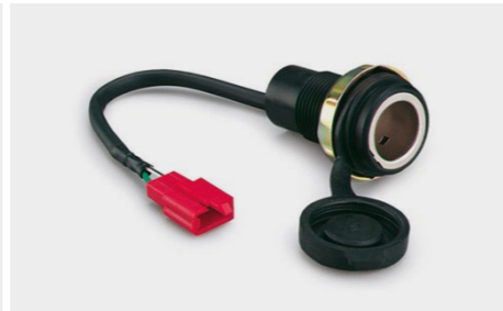
Gniazdo akcesoriów 12 V 08U70-MJM-D00 Gniazdo 12 V umożliwia ładowanie sprzętu elektronicznego. Wiązka elektryczna w zestawie.