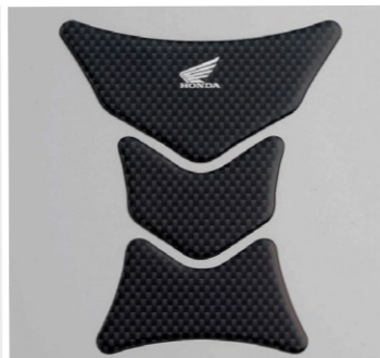
Tankpad (logo Honda Wing) 08P61-MEJ-800 Samoprzylepny, imitacja włókna węglowego, logo Honda Wing. Chroni zbiornik przed zarysowaniami.