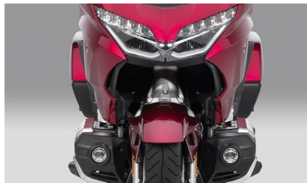
Zestaw lamp przeciwmglnych LED 08ESY-MKC-FLK18

Podnoszą widoczność podczas pochmurnych dni, w nocy lub podczas jazdy w mgłę. Para regulowanych przednich świateł przeciwmglnych LED. Strumień białego światła o wartości 880 lumenów z utwardzoną powierzchnią soczewki i wodoodpornymi złączami. Zestaw zawiera: - Zestaw montażowy lamp przeciwmglnych (08V70-MKC-A00) - Lampy przeciwmglnie LED (08V71-MKC-A00)