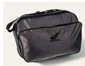
Torba Deluxe do kufra górnego 45L 08L81-MCW-H60

Kufier górny o pojemności 45 litrów może pomieścić dwa pełne kaski i wiele innych rzeczy. Wyposażony w system szybkiego demontażu otwierany kluczykiem motocykla i oparcie. Dostępny w trzech kolorach: - Victory Red (TB45ZF) - Darkness Black Metallic (TB45ZC) - Digital Silver Metallic (TB45ZS) Zestaw zawiera wkładkę zamka, stelaż kufra górnego oraz mocowanie kufra.