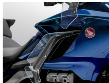
Deflektory górne 08R72-MKC-A01

Dzięki większej wysokości i szerokości zapewnia lepszą ochronę podczas jazdy. Wyższa o 225 mm i szersza o 100 mm niż standardowa przednia szyba w modelach Gold Wing i Gold Wing Tour.