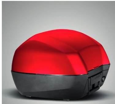
Kufier górny 31L 08ESY-MJM-TB31Z A, B lub H

Kufier górny o pojemności 31 litrów może pomieścić jeden pełny kask i wiele innych rzeczy. Wyposażony w system szybkiego demontażu otwierany kluczykiem motocykla. Podwójne zawiasy i zintegrowane uszczelki wyznaczają nowe standardy projektowania. Dostępny w trzech kolorach: - Victory Red (TB31ZA) - Darkness Black Metallic (TB31ZB) - Digital Silver Metallic (TB31ZH) Zestaw zawiera wkładkę zamka, stelaż kufra górnego oraz mocowanie kufra.