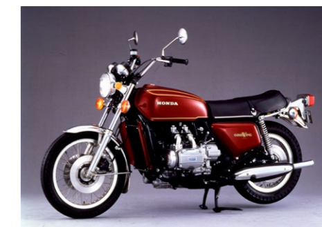
Pierwsza Honda Gold Wing była napędzana chłodzonym wodą, czterocylindrowym silnikiem o pojemności 999 cm 3 .