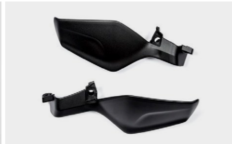
Osłony dłoni 08P70-MJM-D40 Zestaw dwóch osłon dłoni, zapewniających ochronę przed deszczem i wiatrem.