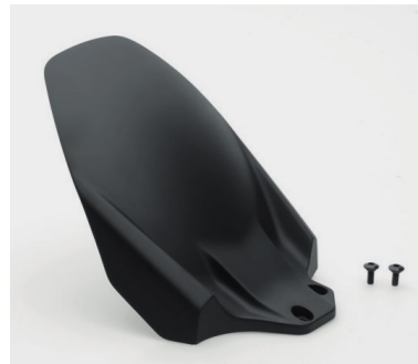
Tylny błotnik 08F70-MJM-D10 Zabezpiecza tylny amortyzator przed błotem, solą i innymi zanieczyszczeniami.