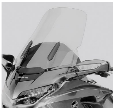
Wysoka szyba 08R71-MKC-ED1

Opcjonalne, wysokiej jakości oparcie z wytłoczonym logo Gold Wing podnosi komfort podróży pasażera. Może być zainstalowane w modelach Gold Wing po zdemontowaniu kufra górnego.