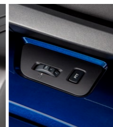
Przełącznik Audio oraz zestaw montażowy 08A70-MKC-A00

Dwa 25-watowe głośniki, które umożliwiają rozbudowę systemu audio do czterech głośników w modelu bez bagażnika. Tylne głośniki są montowane na kufkach bocznych. Aby zamontować głośniki wymagany jest zestaw montażowy tylnych głośników. Tylne głośniki są montowane na kufkach bocznych. Sprzęt i kable w zestawie.