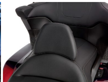
Zestaw oparcia kierowcy 08R75-MKC-A00

Wykonane z poliuretanu deflektory zaprojektowane, aby kierować gorące powietrze z chłodnicy z dala od kierowcy w celu podniesienia komfortu. Zapewniają dodatkową ochronę przed wiatrem.