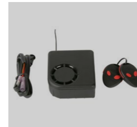
Alarm Spyball z zestawem montażowym 08E50-EWN-800E 08E70-MJM-D00 System alarmowy reagujący na wstrząsy. Ten system nie współpracuje z przełącznikiem magnetycznym. Zestaw wymagany do montażu alarmu.