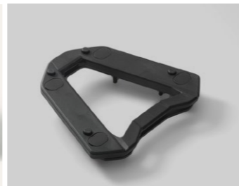
Mocowanie kufra górnego 08L74-MJM-D10 / 08L73-MJM-D10

Wykonana z jasnoszarego nylonu z czarnymi suwakami i z czarnym logo Honda Wing na przedniej kieszeni. Regulowana pojemność od 21 do 33 litrów, przednia kieszeń mieści teczkę rozmiaru A4 Regulowany pas na ramię i uchwyt do przenoszenia.