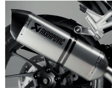
Tytanowy tłumik Akrapović 08F88-MJM-917 Świetny wygląd i lepsze osiągi. Tytanowy tłumik z laserowo wygrawerowanym logo Akrapović. Homologacja drogowa. Spełnia wymagania EURO4.