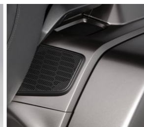
Zestaw tylnych głośników 08ESY-MKC-RR18

Czterocalowe głośniki zaprojektowane specjalnie dla Twojego motocykla, aby zapewnić czystą i wyrazistą muzykę odtwarzaną z najwyższą jakością dźwięku.