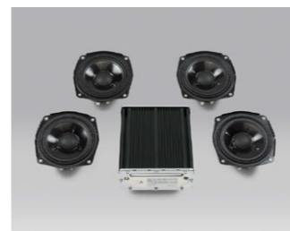
Wzmacniacz z zestawem głośników 08A83-MKC-A00

Czterocalowe głośniki zaprojektowane specjalnie dla Twojego motocykla, aby zapewnić czystą i wyrazistą muzykę odtwarzaną z najwyższą jakością dźwięku.