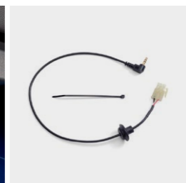
Przewód AUX 08A83-MKC-A00

Wygodny przełącznik sterowania dźwiękiem, który umożliwia pasażerowi regulację głośności oraz zmianę źródła i ścieżki.