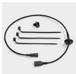
Przewód USB 08E79-MKC-A00

Umożliwia podłączenie cyfrowego urządzenia pamięci masowej do systemu audio motocykla. Musi być zamontowany wewnątrz kufra lub lewym kufrem bocznym.