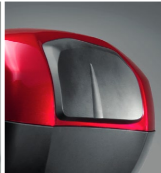
Oparcie pasażera 08F75-MGE-800

Kufier górny o pojemności 31 litrów może pomieścić jeden pełny kask i wiele innych rzeczy. Wyposażony w system szybkiego demontażu otwierany kluczykiem motocykla. Podwójne zawiasy i zintegrowane uszczelki wyznaczają nowe standardy projektowania. Dostępny w trzech kolorach: - Victory Red (TB31ZA) - Darkness Black Metallic (TB31ZB) - Digital Silver Metallic (TB31ZH) Zestaw zawiera wkładkę zamka, stelaż kufra górnego oraz mocowanie kufra.