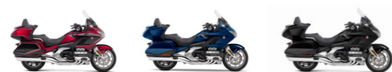
Candy Ardent Red/Black