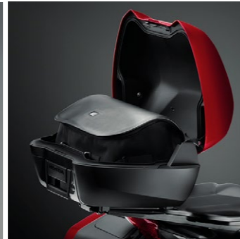
Torba wewnętrzna kufra górnego 08L56-MGE-800A

Czarna torba doskonale dopasowana do kufra 31L, mieści około 20 litrów bagażu, który można zabrać ze sobą. Czarne suwaki i czarne logo Honda Wing oraz regulowany pas na ramię i uchwyt do przenoszenia bagażu.