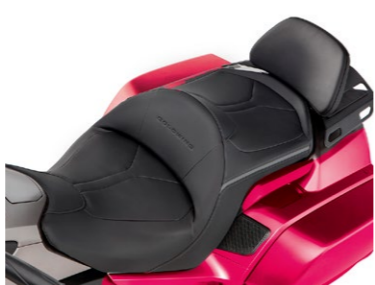
Opcjonalna kanapa 08R76-MKC-A00 / 08R70-MKC-C00

Opcjonalne, wysokiej jakości oparcie z wytłoczonym logo Gold Wing podnosi komfort podróży. W celu ułatwienia dostępu pasażerowi, oparcie można pochylić do przodu. Nie można stosować z opcjonalną kanapą.