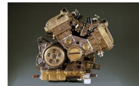
Pierwszy silnik V4 Hondy opracowany w 1978 na zawody Road Racing World Championship

Historia Hondy z czterosuwowymi silnikami V4 DOHC zaczęła się ponad 40 lat temu. Zaprojektowane, by rzucić wyzwanie maszynom z dwusuwowymi silnikami, które zdominowały zawody Road Racing World Championship, NR500 zapoczątkował linię motocykli Honda, których geny znajdziemy w VFR800F: niedościgniona elastyczność, płynność i czysta moc dostarczane przez silnik V4