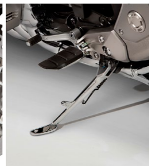
Chromowana podpórka boczna 08M70-MKC-A00

Podnoszą prestiż dodając więcej elegancji. Zwiększony przepływ powietrza zapewnia lepsze chłodzenie przednich zacisków. Dostępne w dwóch kolorach: - Black (08F74-MKC-A00) - Chrome (08F73-MKC-A00).