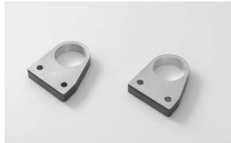
Dystanse do kierownicy 08R70-MJM-D10 Aluminiowe dystanse, umożliwiają podniesienie kierownicy o 15 mm.