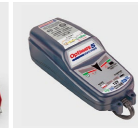
Ładowarka Honda Optimate 5 08M51-EWA-801E Nowa ładowarka Honda Optimate 5 pozwala przywrócić sprawność akumulatora rozładowanego nawet do 2 V, a następnie automatycznie naładować go do maksymalnego poziomu. Pojemność akumulatora: 15-192 Ah. Zastosowanie: akumulatory MF / AGM, STD, GEL, EFB