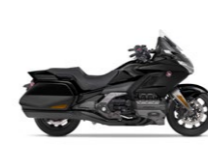
Darkness Black Metallic