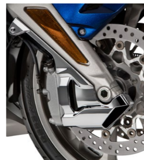
Ostony przednich zacisków 08F74-MKC-A00

Podnoszą prestiż dodając więcej elegancji. Zwiększony przepływ powietrza zapewnia lepsze chłodzenie przednich zacisków. Dostępne w dwóch kolorach: - Black (08F74-MKC-A00) - Chrome (08F73-MKC-A00).