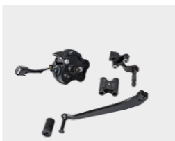
Dźwignia zmiany biegów (DCT)* 08U71-MKC-A00

Posiada specjalnie zaprojektowany wzór ściegu z wytłoczonym logo Gold Wing. Aksamitne wykończenie siedziska i wyższe oparcie kierowcy zapewnia dodatkowe oparcie i podnosi komfort użytkowania. Zbudowany na wysokiej jakości fabrycznej formie siedzenia. Zawiera przelączniki podgrzewania. Nie można stosować z oparciem kierowcy: specjalna wersja z czujnikiem siedzenia dostępna wyłącznie dla modeli z DCT (08R70-MKC-C00).