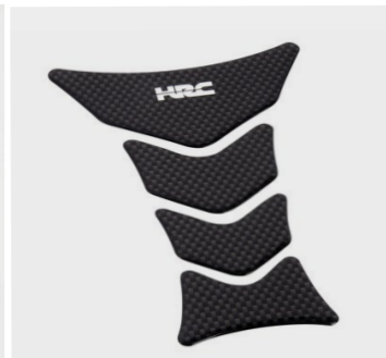
Tankpad (logo HRC) 08P61-KAZ-800B Samoprzylepny, imitacja włókna węglowego, logo HRC. Chroni zbiornik przed zarysowaniami.