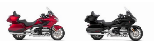
Candy Ardent Red