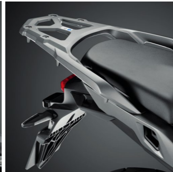
Stelaż kufra górnego 08L71-MJM-D10

Czarna torba doskonale dopasowana do kufra 31L, mieści około 20 litrów bagażu, który można zabrać ze sobą. Czarne suwaki i czarne logo Honda Wing oraz regulowany pas na ramię i uchwyt do przenoszenia bagażu.