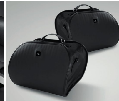
Zestaw toreb do kufków bocznych 08L56-MGE-800B

Zestaw dwóch zintegrowanych, aerodynamicznych kufków o pojemności 29 litrów każdy w dopasowanym kolorze. Montowane bezpośrednio do motocykla (nie wymagają stelaży), otwierane kluczykiem motocykla. Lewy kufier może pomieścić większość pełnych kasków. Dostępne w trzech kolorach: - Victory Red (PANZA) - Darkness Black Metallic (PANZB) - Digital Silver Metallic (PANZK) Zestaw zawiera wkładkę zamka oraz paski do mocowania bagażu wewnątrz.