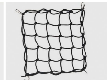
Siatka mocująca bagaż 08L63-KAZ-011

Torba z magnesem do łatwego zamocowania do zbiornika paliwa. Pojemność 13 litrów, swobodnie mieści teczkę/akta rozmiaru A4. W zestawie pokrowiec przeciwdeszczowy.