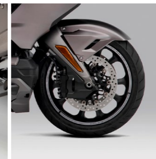
Zestaw naklejek na koła 08F71-MKC-A10ZB

Chromowana podpórka boczna dodaje stylu motocyklowi.