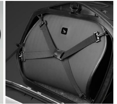
Wewnętrzne paski do kufków bocznych 08L45-MGE-800

Dwie modne, czarne torby do kufków bocznych z czarnymi suwakami i czarnym logo Honda Wing. Każda o pojemności 18 litrów, wyposażone w pasek i uchwyt, idealnie pasują do kufków bocznych 29L.