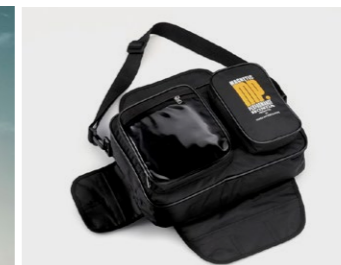
Magnetyczna torba na zbiornik 08L56-KAZ-800

Torba z magnesem do łatwego zamocowania do zbiornika paliwa. Pojemność 13 litrów, swobodnie mieści teczkę/akta rozmiaru A4. W zestawie pokrowiec przeciwdeszczowy.