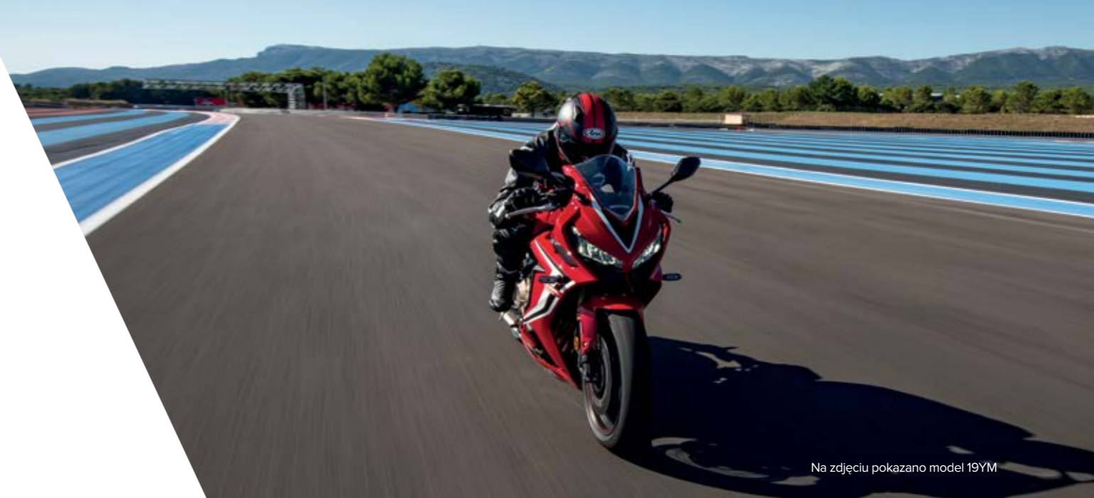
Na zdjęciu pokazano model 19YM

Wymiary w mm (szer. x dł. x wys.): 355 x 365 x 243.