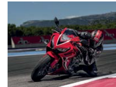
CBR650R w akcji.

Kierowca może wyłączyć ten system według własnego uznania.